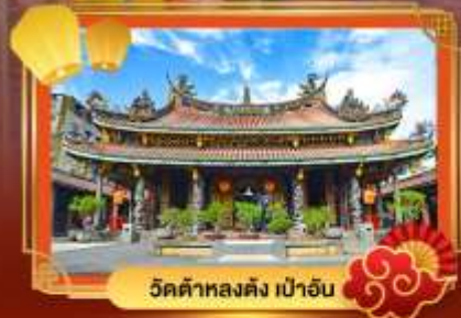
วัดต้าหลงตง เป่าอัน