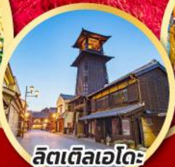
ลิตเติลเอโดะ เมืองควาโกเอะ