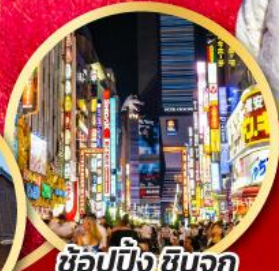
ช้อปปิ้งซินจุกุ