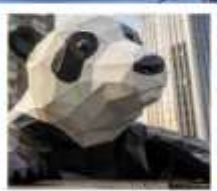
ห้าง IFS หมีแพนด้าเป็นตึก