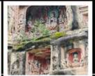
หินแกะสลักหนานคาน

PERIOD 1 : 13 - 17 ต.ค. 2569 PERIOD 2 : 17 - 21 ต.ค. 2569