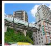
รถไฟกะลุดี้ก

ภูเขาถ้ำหวู่ซาน (รวมกระเช้า) • อุทยานหมีซานซาน หินแกะสลักหนานคาน • ชมรถไฟกะลุดี้ก หงหยาดัง • ถนนคนเดินเจียฟางเป่ย์