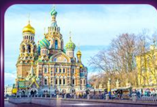
โบสถ์แห่งหยดเลือด