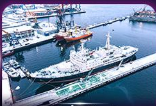
เรือตัดน้ำแข็งเลนิน