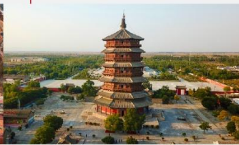
วัดเจดีย์ไม้ มู่ต้า

*ทางบริษัทฯ ขอสงวนสิทธิ์ในการสลับโปรแกรมทัวร์ตามความเหมาะสมขึ้นอยู่กับสถานการณ์หน้างาน โดยคำนึงถึงผลประโยชน์ของลูกค้าเป็นสำคัญ