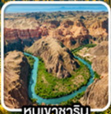
หุบเขาซาริน