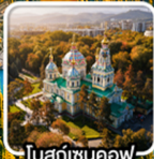
โบสถ์เซนคอฟ

นั่งกระเช้าคอนโดล่าขึ้นสู่ชิมบูลัก สตรีสออร์ก ไร่มุกแห่งเทือกเขาเทียนชาน ทะเลสาบโคลโซ หุบเขาเจดี โองูซ / ภูเขาหินเทพนิยาย / ทะเลสาบอัสซิกกุล ชมการแสดงการล่าเหยื่อของนกอินทรี