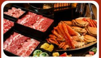
บุฟเฟ่ต์ซาบู ซาปู 3 ชนิด