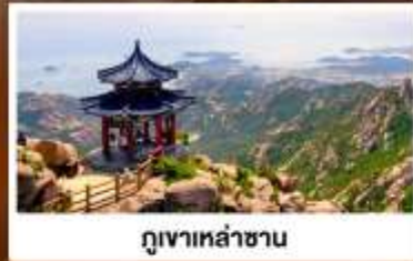
ภูเขาเหล่าซาน