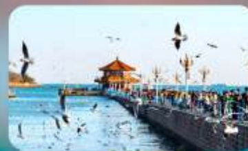
สะพานจันเฉียว