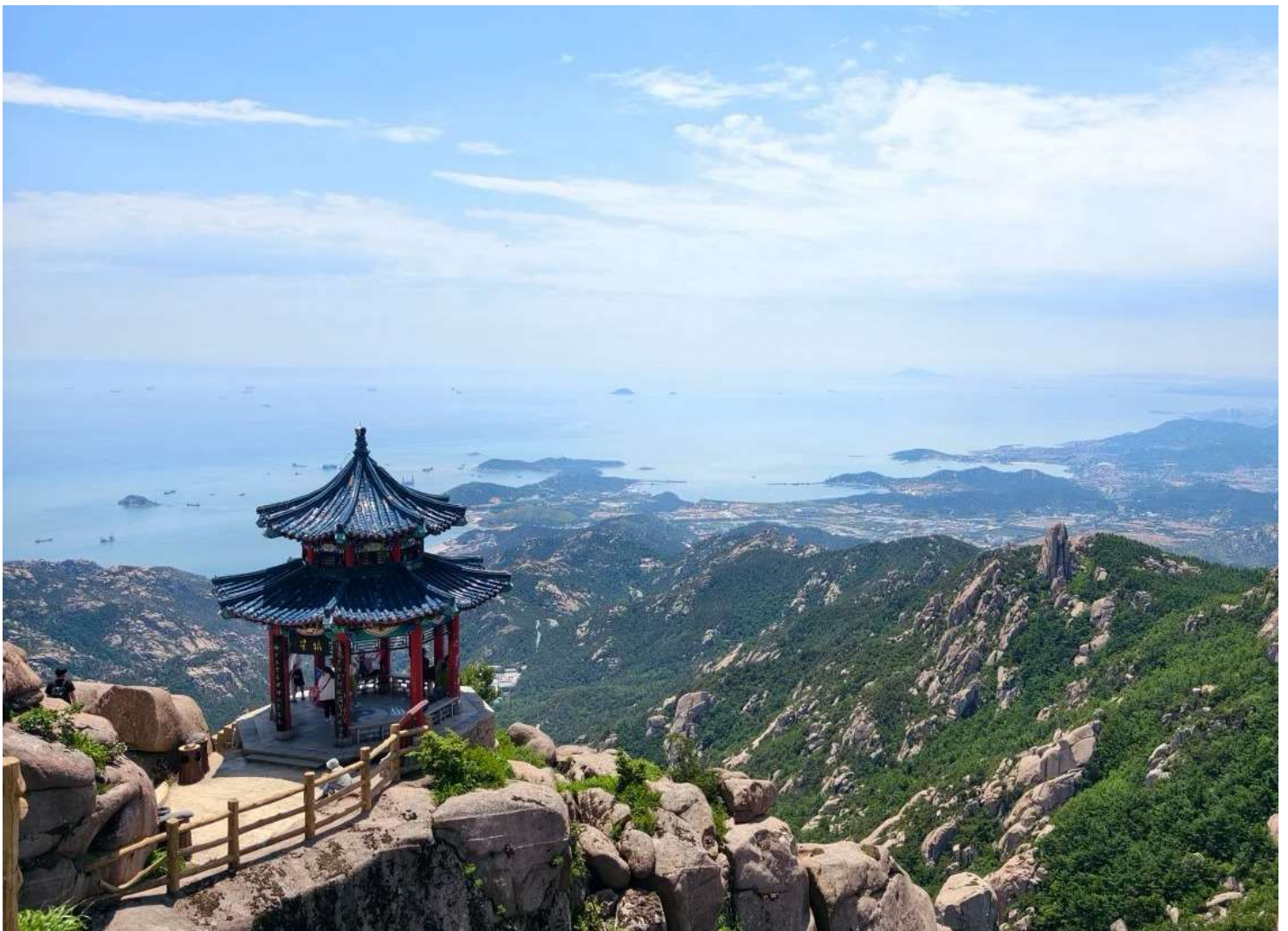
สูงประกอบด้วยจุดท่องเที่ยวหลักหลายแห่ง (ราคานี้รวมค่ารถอุทยานแล้วเที่ยวดำหนักไทชิงกง)

นำท่านสู่ ภูเขาเหลาชาน สัมผัสพลังแห่งขุนเขาศักดิ์สิทธิ์ แหล่งท่องเที่ยวระดับ 5A เมืองชิงเต่า มณฑลซานตงภูเขาศักดิ์สิทธิ์แห่งลัทธิเต๋า ที่ผสมผสานธรรมชาติและศาสนาได้อย่างลงตัวมี นอกจากนี้ภูเขาเหลาชานยังเป็นที่ตั้งของวัดและศาลเจ้าประวัติศาสตร์หลายแห่งที่สะท้อนวัฒนธรรม และความเชื่อแบบจีนดั้งเดิม อีกทั้งภูเขาแห่งนี้ปรากฏในตำนานและวรรณกรรมจีนหลายเรื่อง เช่น มีเรื่องเล่าว่าจักรพรรดิฉินสื่อหวง และจักรพรรดิฮั่นอู่ เคยเสด็จมาที่นี่เพื่อ แสวงหาความเป็นอมตะจากเซียน จุดเด่นอีกอย่างของภูเขาเหลาชาน คือ วิวทะเลที่มองเห็นได้จากยอดเขา ท่านจะได้ชมวิวแบบสวยงามของท้องทะเลจากมุม