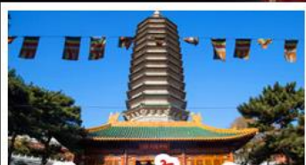
วัดพระเขี้ยวแก้ว