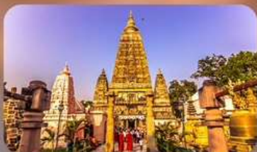
วัดมหาโพธิ์