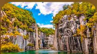
เขาดงตึกปะเมืองโพซอน

คามหาไปไม่เปลี่ยนสีสุดโรแมนติก ชมวิวเมเปิ้ลหลากสีจากสะพานแวงรูปตัว Y แห่งเมืองโพซอน สัมผัสความงดงามของโพซอนอาร์ทวอลล์ • เดินเล่นท่ามกลางต้นแปะก๊วยและเมเปิ้ลในพระราชวังเคียงบกกุง ชมหมู่บ้านอันอกกลางบรรยากาศชิวๆ และปิดท้ายด้วยทุ่งหญ้าสีทอง ณ สวนฮานึล แลนด์มาร์กยอดนิยมของกรุงโซล ในช่วงฤดูใบไม้เปลี่ยนสีที่สวยงามที่สุด