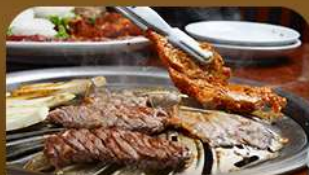
เมนูย่างสไตลเกาหลี