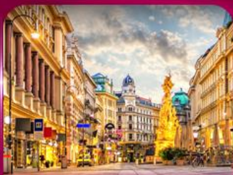
ชมเมืองโรมานติก เวียนนา