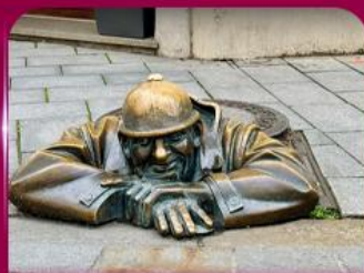
เชลฟ์คูคูมิล บราติสลาวา