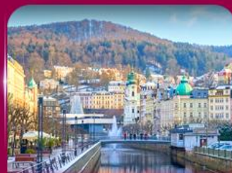
เมืองสปาแสนสวย คาร์โลวี วารี