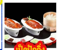
เปิดปิ้งกั๊ง