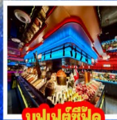
บุฟเฟต์ซีฟู้ด