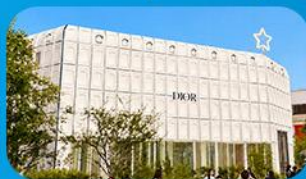
บรักคินกาหลี่