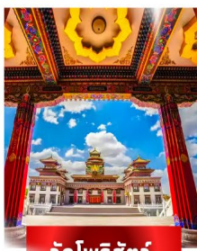
วัดโพธิ์สัตว์