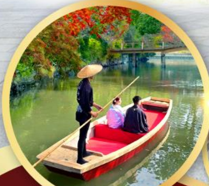
กิจกรรมล่องเรือยามากาวะ