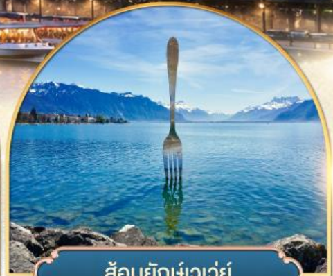
ส้อมยักเข่าเว้ย