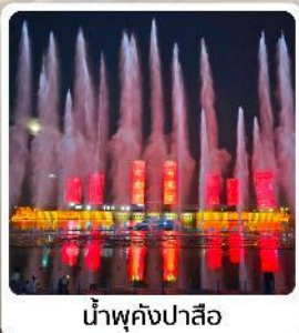
น้ำพุคังปาสือ