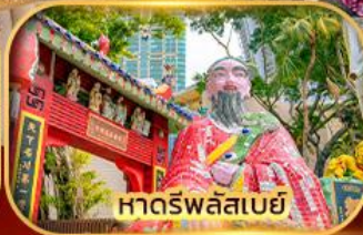
หาดร์พลัสเบย์