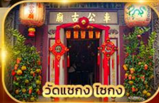
วัดเขกง ไชกง