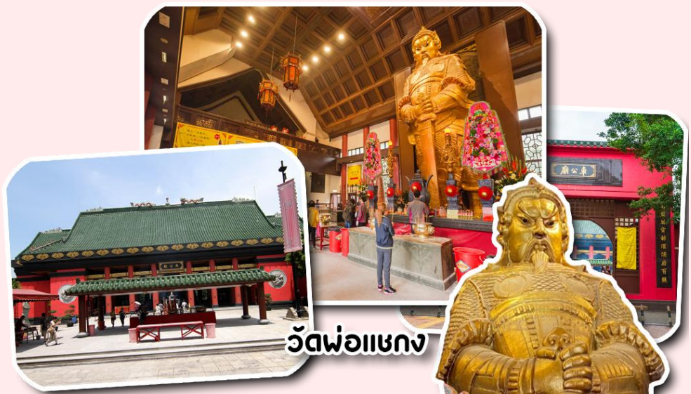
วัดพ่อแชกง