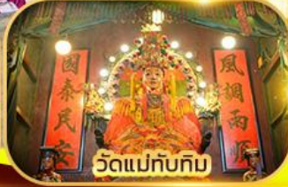
วัดแม่ทับทิม