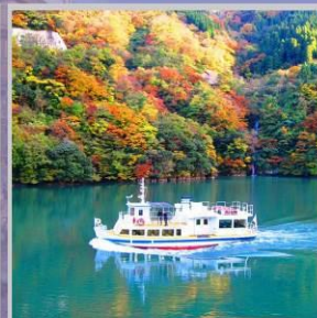
"SHOGAWA YURAN CRUISE"