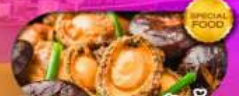
พิเศษเมนู หอยเป๋าฮื้อ เดินทาง มีนาคม 69