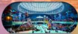
รวมค่าเข้าสวนสนุก SpaceShip Park