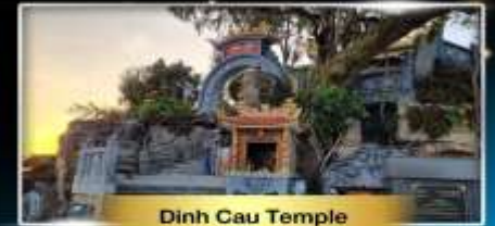
Dinh Cau Temple