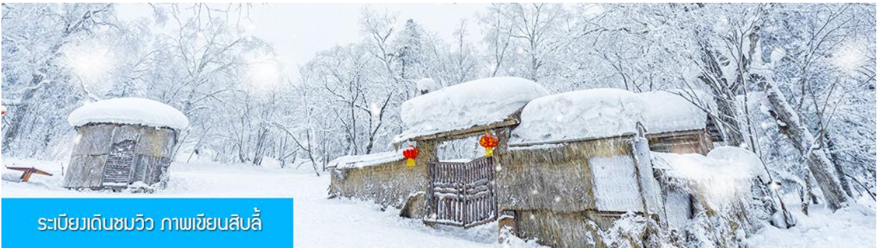
ระเบียบวณดินชมวิว ภาพเขียนสิบลี้