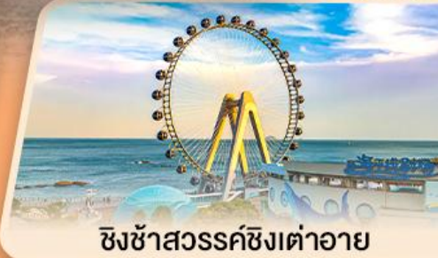
ซิงซ่าสวรรค์ซิงต้าอาย