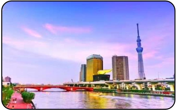
แม่น้ำสุมิตะ

สักการะ วัดมัตสึจิยามะโชเต็น หรือ “วัดหัวไชเท้า” ซึ่งเป็นวัดเก่าแก่ในย่านอาซากุสะ เป็นวัดเก่าแก่ในย่านอาซากุสะ กรุงโตเกียว ตั้งอยู่บนเนินเขาเล็ก ๆ ริมแม่น้ำสุมิตะ จุดเด่นคือเป็นวัดที่ขึ้นชื่อเรื่อง “ขอพรด้านการเงิน” โชคลาภ และความสำเร็จในธุรกิจ ส่วนไฮไลต์สำคัญของวัดนี้คือ ไคคอน หรือหัวไชเท้า สัญลักษณ์ศักดิ์สิทธิ์ คนที่นี้เชื่อว่าไคคอนช่วย “ชำระล้างสิ่งไม่ดี” และนำโชคลาภเข้ามา นักท่องเที่ยวมักนำไคคอนไปถวายเพื่อขอพร