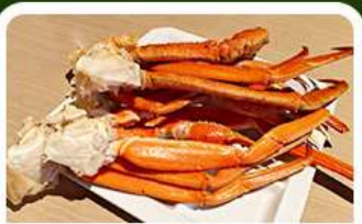
เมนูพิเศษ! ขาปู

เกาะเอโนะชิมะ วิวสวยงามติด 1 ใน 100 ภูมิทัศน์ญี่ปุ่น พร้อมชมพรวนศาลเจ้าศักดิ์สิทธิ์ เที่ยวเต็มทั้ง 3 วัน แบบจุใจ ทั้งวัด ศาลเจ้า สวนดอกไม้ และช้อปปิ้ง