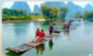
ล่องแพไม้ไผ่ที่ทง