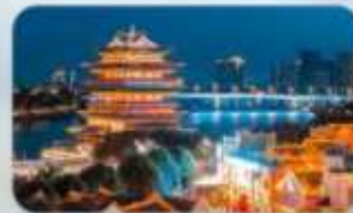
ถนนสามสายสองตอรอก