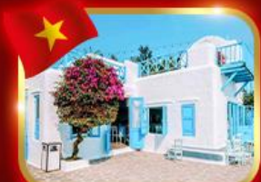
คาเฟ่สุดชิค ซานทรา มารีน่า