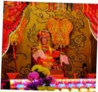
เจ้าแม่ทับทิม จอสเฮ้าส์เบย์