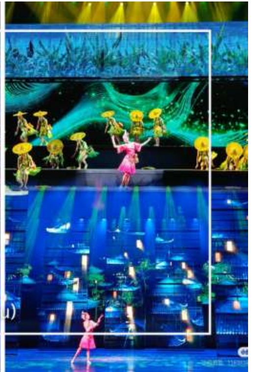
การแสดงโชว์ซีลิ่งคาปู (Xilan Kapu)

เดินทางเข้าโรงแรมที่พัก Xiazhou Hotel ระดับ 4 ดาวหรือเทียบเท่า