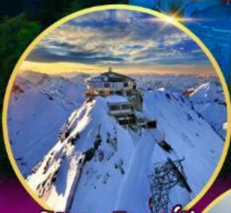
ยอดเขาซิลรอร์น