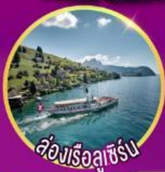
ล่องเรือลูซิเิร์น