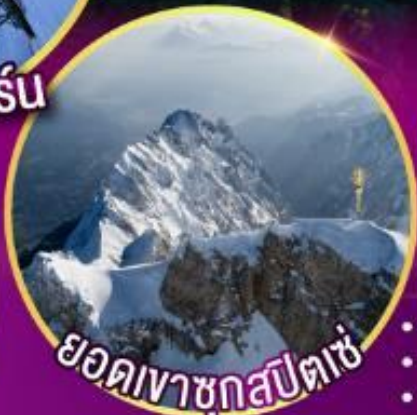
ยอดเขาชุกสปีตเซ