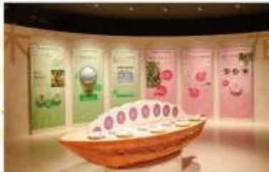
ROYCE CACAO & CHOCOLATE TOWN