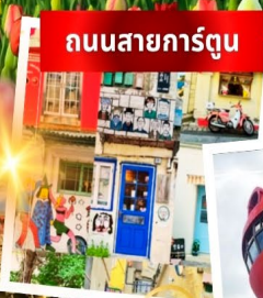
ถนนสายการ์ตูน