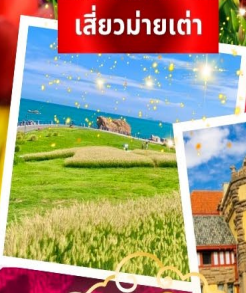
เสี้ยวมายเต่า

ปิ้งย่างเกาหลี อาหารทะเลซีฟู้ด + บุฟเฟต์เชิยร์ ดื่มไม่อั้น