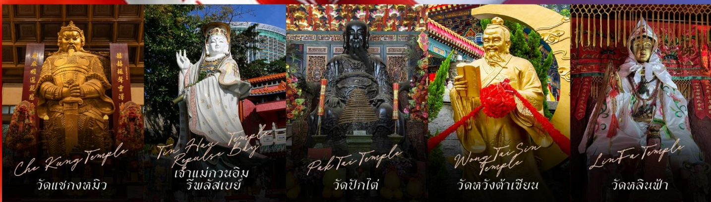
Che Kung Temple วัดแซกงหมิว

รายการทัวร์ข้างต้นอาจมีการปรับเปลี่ยนเพื่อความเหมาะสม