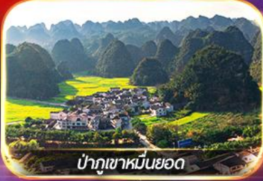
ป่าภูเขาหมื่นยอด