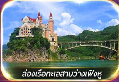
ล่องเรือทะเลสาบว่างเฟิงหู