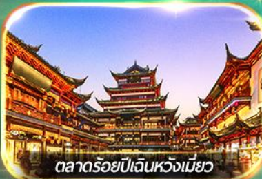
ตลาดร้อยปีเงินหวังเหมียว