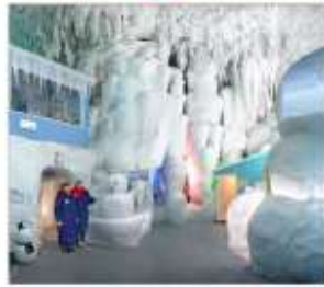
พิพิธภัณฑ์น้ำแข็ง