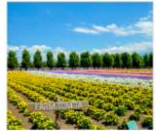
ทุ่งลาเวนเดอร์โทมิตะ