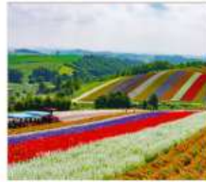
ทุ่งดอกไม้หลากสี