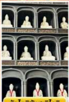
วัดโดชิซังเซโอดีจิ