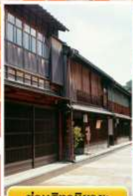
ย่านอิงาชิซายะ