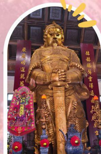
วัดแซกง ขอพรโชคลาก การเงิน และธุรกิจ