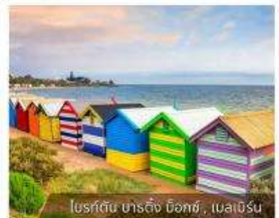
โบสถ์ดิน ชาติถึง ด็อกซ์, เมลเบิร์น