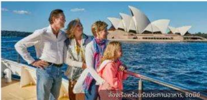
ล่องเรือพร้อมรับประทานอาหาร, ซิดนีย์