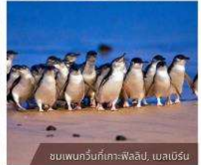
ชมเพนกวินที่เกาะฟิลลิป, เมลเบิร์น