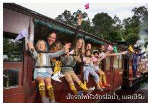
นั่งรถไฟหัวจักรไอน้ำ, เมลเบิร์น