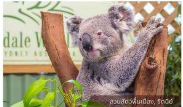
สวนสัตว์พื้นเมือง, ซิดนีย์