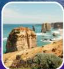
Great Ocean Road (ครึ่งสาย)