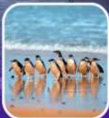
เพนกวินที่เกาะฟิลลิป