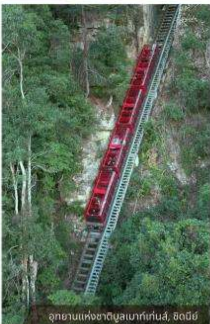
อุทยานแห่งชาติบลูเมาท์เทนส์, ซิดนีย์