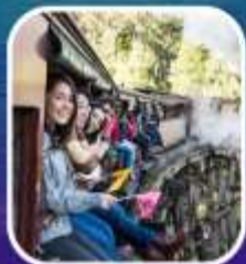
รถไฟจักรไอน้ำโบราณ