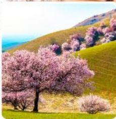
ทุ่งดอกอัลมอนด์