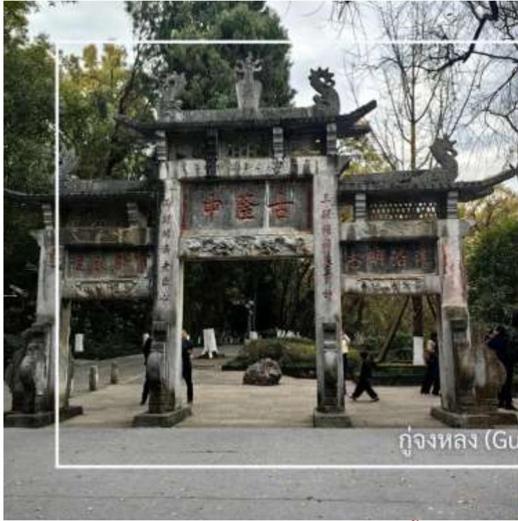
กุ๋หลงจง (Gulongzhong)

หลังอาหารเช้านำท่านสู่ กุ๋หลงจง (Gulongzhong) แหล่งท่องเที่ยวทางประวัติศาสตร์และวัฒนธรรมที่มีชื่อเสียง ตั้งอยู่ใกล้เมืองเซียงหยาง เป็นสถานที่พำนักของ จูกัดเหลียง (ขงเบ้ง) นักปราชญ์และนักยุทธศาสตร์ผู้ยิ่งใหญ่แห่งยุคสามก๊ก สถานที่แห่งนี้ในอดีตคือสถานที่ที่เล่าปี่ได้เดินทางมาพบกับจูกัดเหลียงที่เชิญตัวไปร่วมทัพ ปัจจุบันสถานที่นี้โอบล้อมด้วยธรรมชาติ สะท้อนบรรยากาศแห่งการศึกษา และวางแผนการเมืองในอดีต พร้อมให้ท่านได้เรียนรู้เรื่องราวทางประวัติศาสตร์อันทรงคุณค่า พร้อมสัมผัสบรรยากาศที่เชื่อมโยงกับตำนานและภูมิปัญญาจีนโบราณ จึงนับเป็นจุดหมายสำคัญสำหรับผู้ที่สนใจประวัติศาสตร์ยุคสามก๊ก และวัฒนธรรมจีน