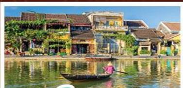
เมืองโบราณเฮอฮัน

! พักบนเขานาฮิลล์ 1 คืน ! สัมผัสอากาศเย็นตลอดปี สตรีตฟรังเศสสุดคลาสสิก - นั่งกระเช้ายาวที่สุด สู่มานาฮิลล์ สนุกสุดมันส์ไปกับสวนสนุก The Fantasy Park นมัสการเจ้าแม่กวนอิมองค์ใหญ่ที่สุดของเมืองดานัง - เช็กอินเมืองมรดกโลกฮอยอัน - สนุกสนานไปกับกิจกรรม!!นั่งเรือกระดิง หมู่บ้านกัมถาน เช็กอินร้านกาแฟ SON TRA MARINA CAFE - ไม่ลงร้านช้อปปิ้ง - อิ่มอร่อยกับบุฟเฟ่ต์นานาชาติ , หม้อไฟซีฟู้ด