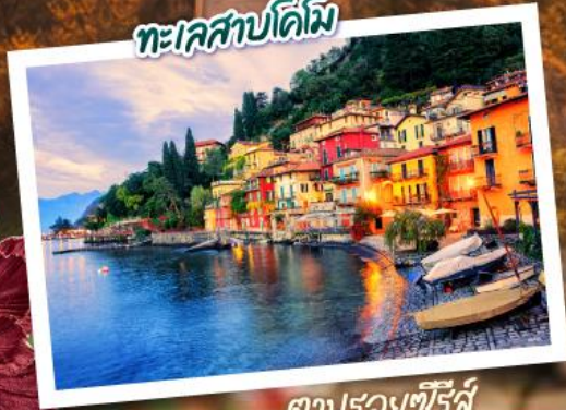
ตามรอยซีรีส์