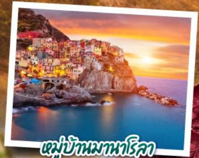
หมู่บ้านมานาโรคา