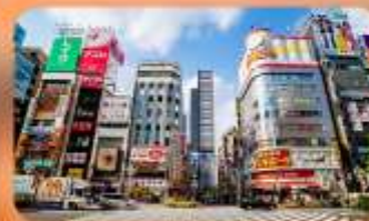
ซ้อปปิ้งชินจูกุ