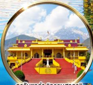
ดาริมซาล่า "ธรรมศาลา" ตำหนักองค์ดาไลลามะ