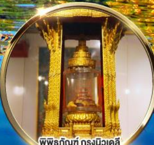
พิพิธภัณฑ์ กรุงนิวเดลี ถราบนมัสการพระบรมสารีริกธาตุ