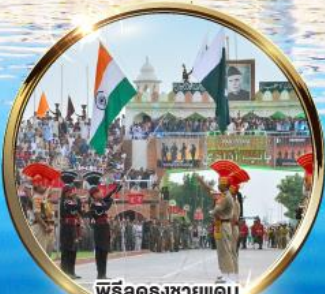
พิธีลดธงชัยแดน อินเดีย-ปากีสถาน ผ่านวาทะห์