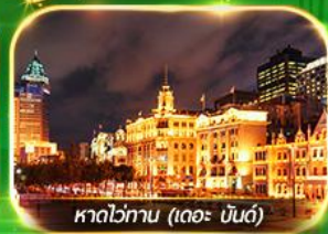
หาดไข่มุก (เดอะ บันด์)

เที่ยวมหานครเซี่ยงไฮ้ ถ่ายรูปเช็กอินที่ Tian An 1000 Trees, ซินเทียนตี้ ช้อปปิ้งตลาดเงินหวงเหมียว, ถนนนานกิง