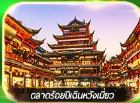
ตลาดร้อยปีเงินหวงเหมียว