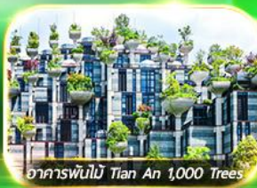
อาคารพันไม้ Tian An 1,000 Trees