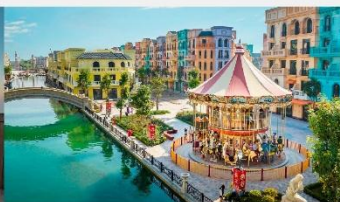
Mega Grand World