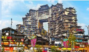
ตีทมหัตถกรรม 72