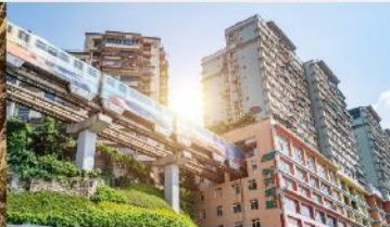
รถไฟฟ้าทะเลตึก