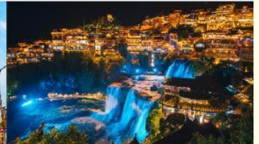
หมู่บ้านโบราณฟูหลงเจิน

*ทางบริษัทฯ ขอสงวนสิทธิ์ในการสลับโปรแกรมทัวร์ตามความเหมาะสมขึ้นอยู่กับสถานการณ์หน้างาน โดยคำนึงถึงผลประโยชน์ของลูกค้าเป็นสำคัญ