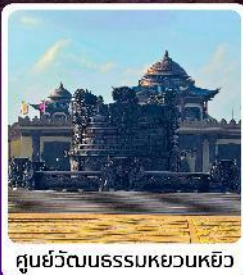
ศูนย์วัฒนธรรมหยวนหยิว